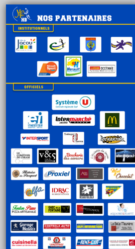
ROLL UP > & SITE WEB Home page

RÉSULTATS DU WEEK-END MATCH À VENIR SITE WEB & FACEBOOK