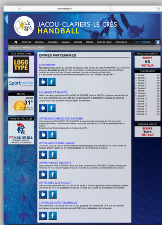
< SITE WEB Home page